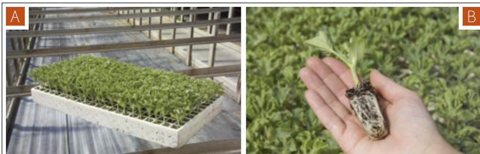
Figura 2. A) Follaje de plántulas de sandía saludable. B) Sistema de raíces de una plántula de sandía sana.