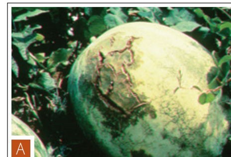
Figura 5. A) Síntomas típicos de BFB sobre sandía incluyendo la pudrición y grietas en la cáscara de la fruta. B) Síntomas de BFB en fruta de Honeydew incluyendo lesiones con grietas, rodeado por lesiones aguanosas.

semanas después de la polinización); sin embargo los síntomas son usualmente más aparentes durante las últimas dos semanas de desarrollo del fruto. En el fruto de la sandía inician como áreas pequeñas, aparentemente grasientas y llenas en agua de menos de dos centímetros y medio de diámetro con márgenes irregulares. Inicialmente estas lesiones no se extienden al interior de la pulpa del fruto, pero posteriormente las lesiones se