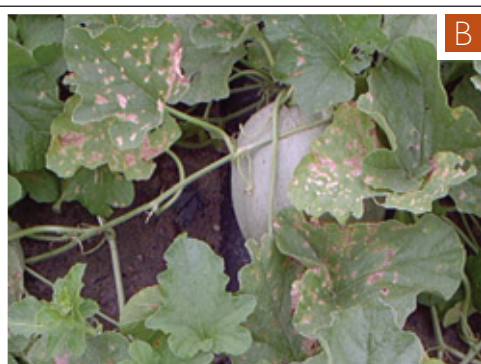
Figura 4. A) Síntomas de BFB en hojas de sandía maduras. B) Lesiones de BFB en hojas de melón. Nótese el aspecto bronceado a blanco.