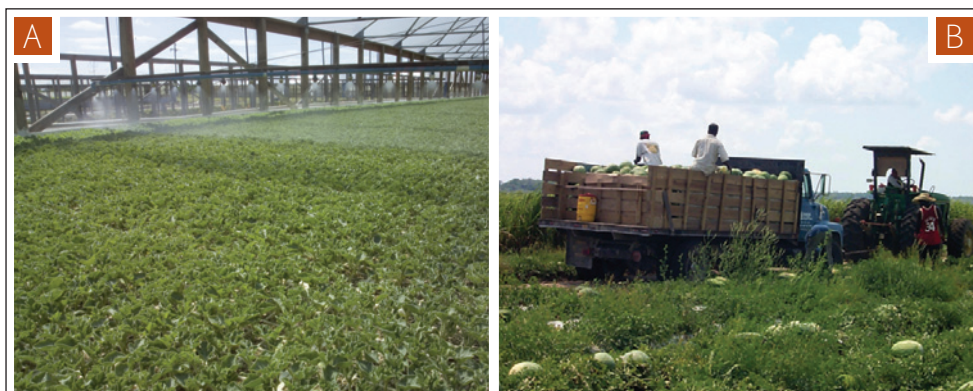
Figura 1. Prácticas de producción desempeñan un importante papel en la propagación de las bacterias causantes de BFB. A) El riego por aspersión sobre las plantas es un factor clave en la propagación de bacterias en el invernadero. B) El Equipo puede propagar el problema de un campo a otro.